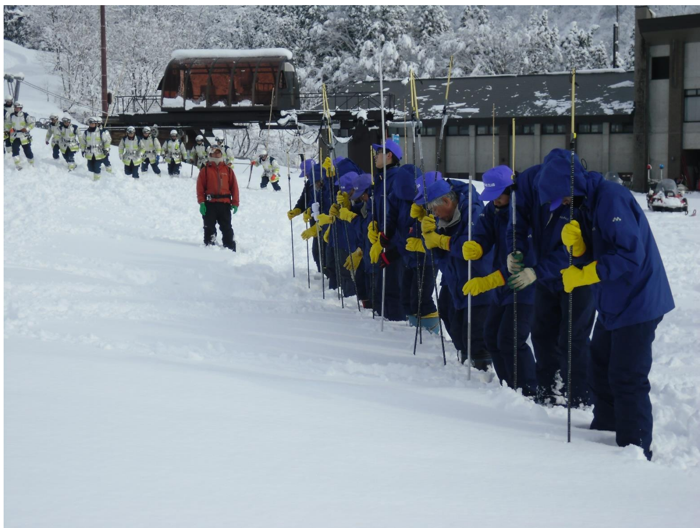
栄村スキー場 第1～第3ペアリフト